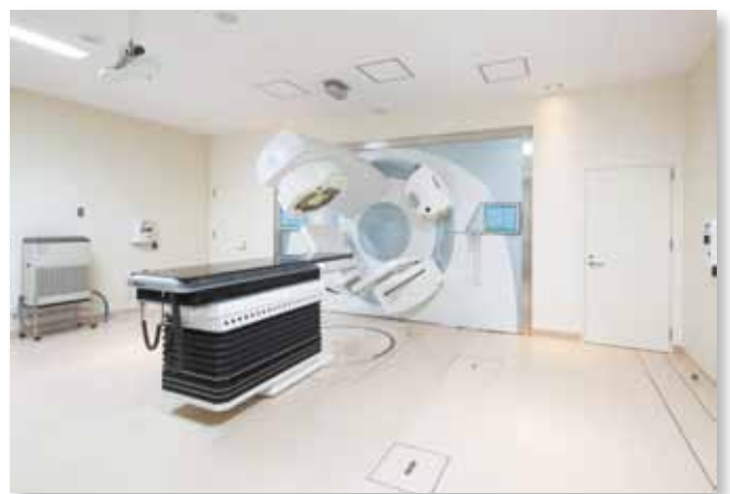
リニアック(高精度照射対応)

日々の診療には放射線治療専門医をはじめとして、放射線治療専門技師・医学物理士や専従の看護師などのスタッフが協力してあたりますので、安心して治療を受けていただけます。