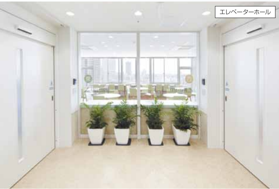
エレベーターホール