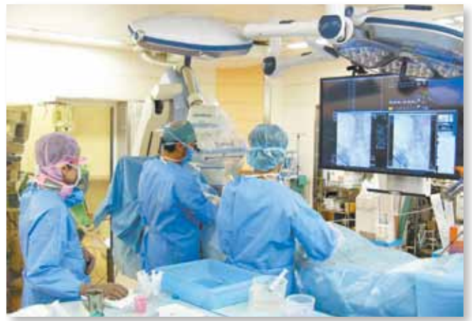
腹部大動脈瘤に対するステントグラフト内挿術が行われた 大阪病院の「ハイブリッド手術室」