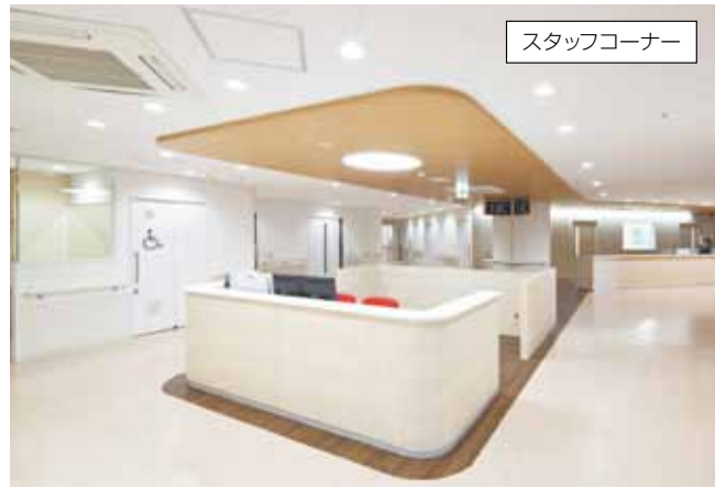
スタッフコーナー